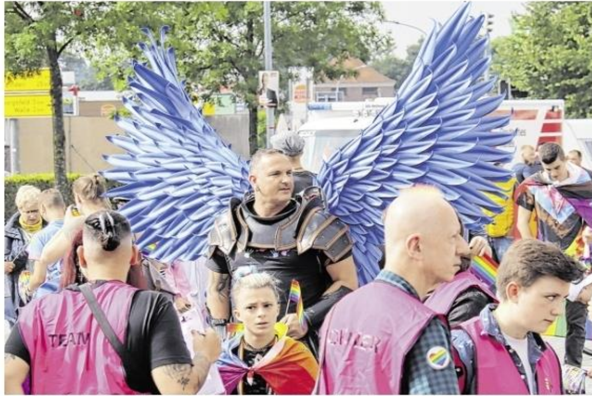
Zum siebten Mal fand am Sonnabend der Christopher Street Day in Aurich statt. Einige Hundert Teilnehmer zogen mit der Demonstration vom Karl-Heinrich-Ulrichs-Platz zum Rathaus, wo die Kundgebung stattfand.