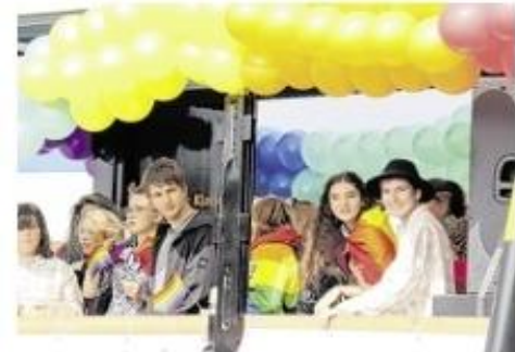
Zwei bunt geschmückte Lastwagen mit viel Musik führten den Zug durch Aurich an.

ne Gedenktafel für Ulrichs enthält. Karl Heinrich Ulrichs (1825 bis 1895) gilt als einer der ersten bekannten Vorkämpfer für die rechtliche Gleichstellung von Homosexuellen.