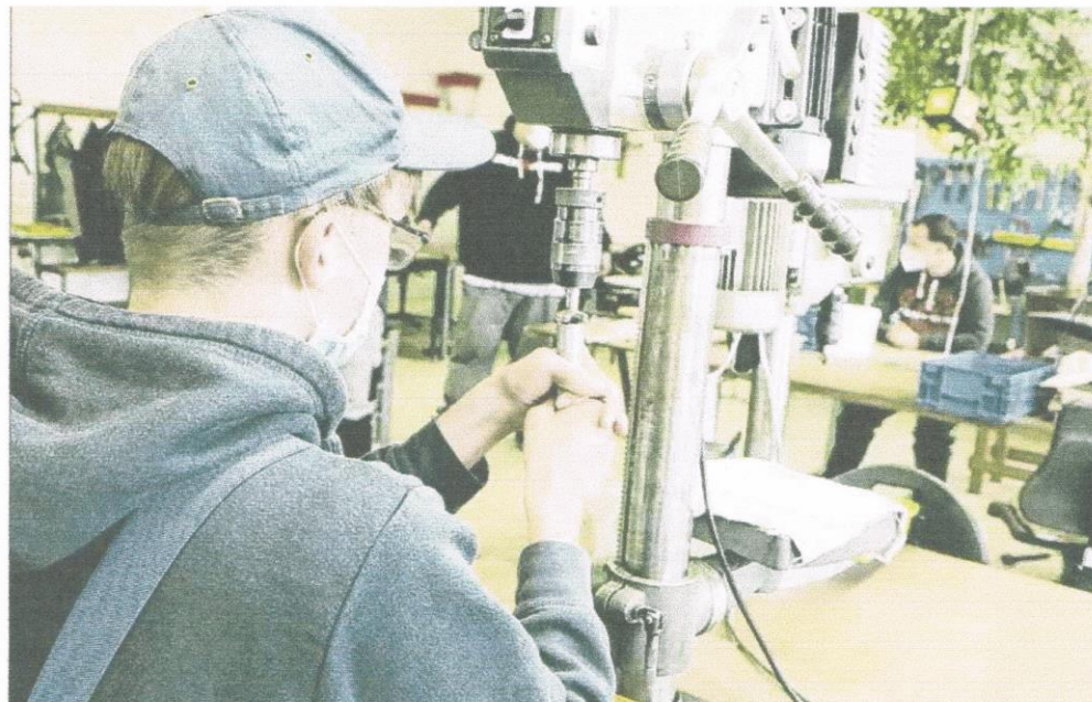
Werkstätten für Menschen mit Behinderung sind wichtige Zulieferer für die Industrie.

Das Unternehmen hatte zunächst Berufung eingelegt, diese aber zurückgenommen. Mittlerweile ist das Urteil rechtskräftig. „Ich möchte, dass andere Werkstätten das mitbekommen“, sagt der 49-Jährige, der an einer Borderline-Persönlichkeitsstörung leidet und zu 70 Prozent schwerbehindert ist. Die WfbM sind ein Sozialunter-