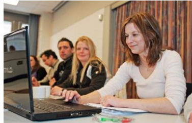
Kinder- und Jugendhilfe