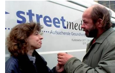
Menschen in besonderen sozialen Schwierigkeiten 1882