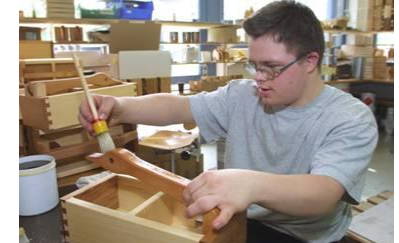
Arbeit und berufliche Rehabilitation