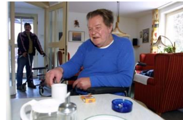
Menschen mit erworbenen Hirnschädigungen 1997