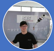
SGB II und III – Menschen mit Erwerbsminderung/ besonderen Hemmnissen