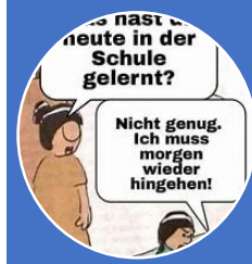
Förder- und Schwerpunktschüler*innen