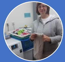
SGB IX – auf Dauer voll erwerbsgeminderte Menschen