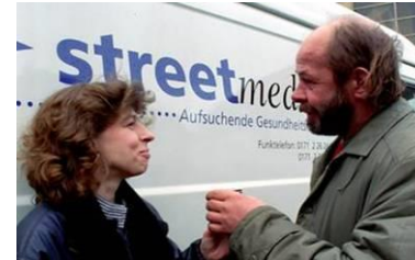
Menschen in besonderen sozialen Schwierigkeiten 1882