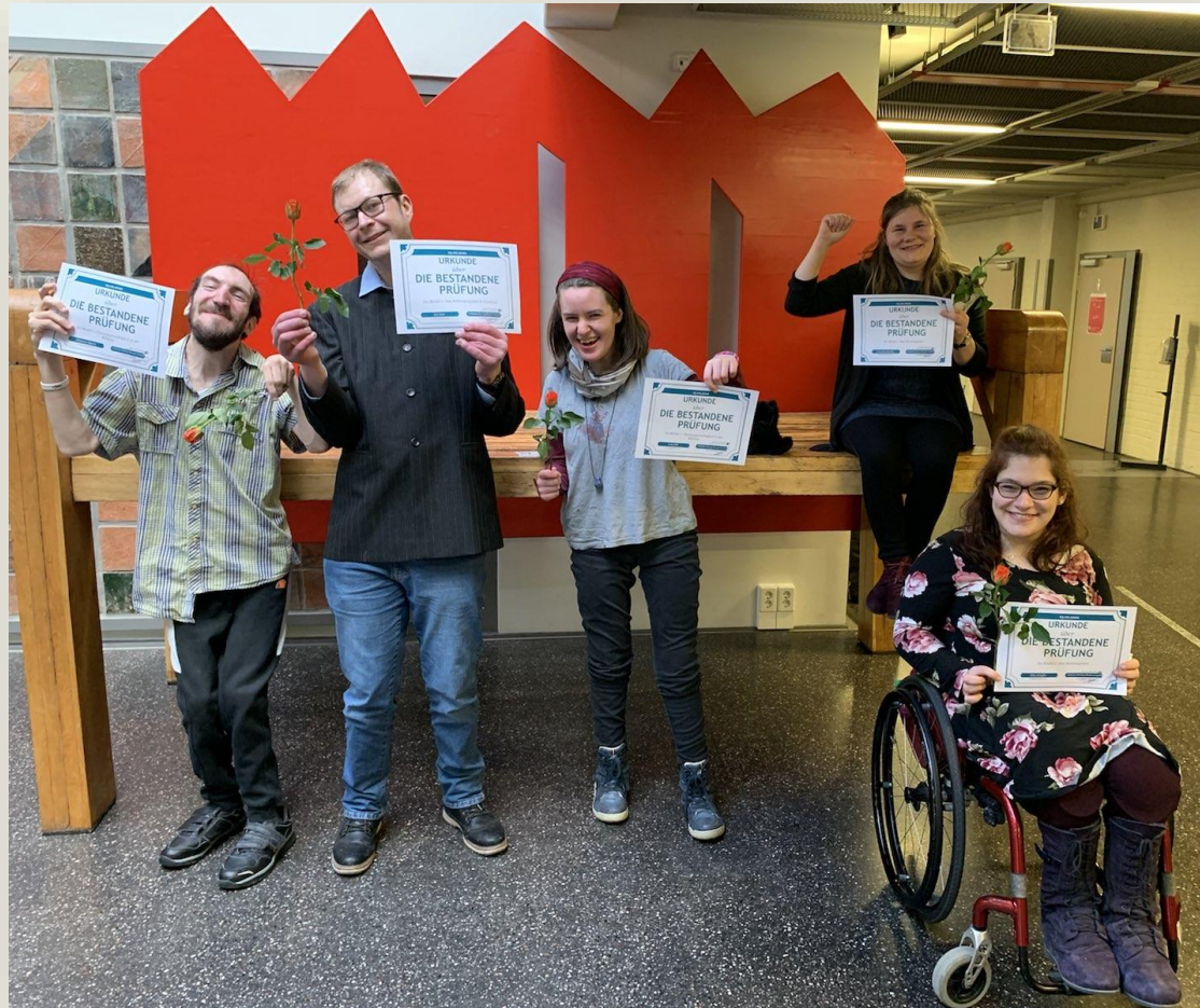
Jubel nach bestandener erster Modulabschlussprüfung im Februar 2022