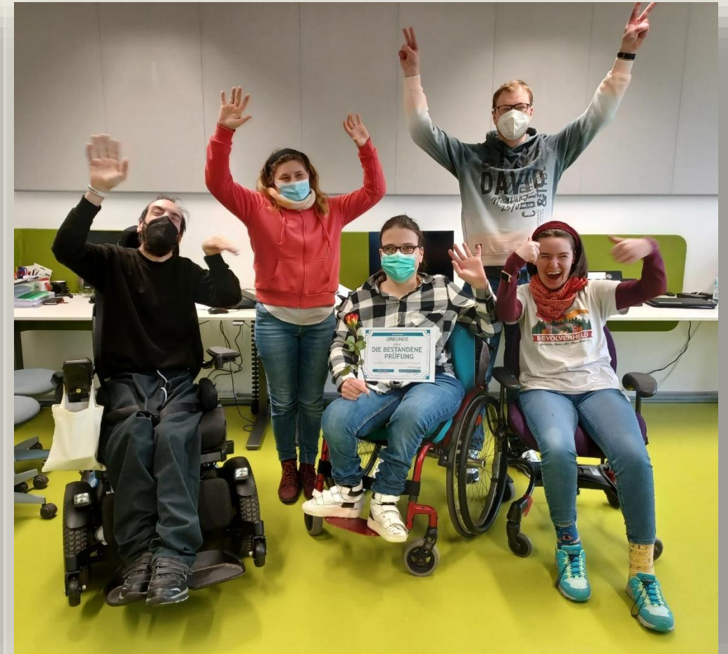
Zwei Fotos zeigen die angehenden Bildungsfachkräfte jubelnd mit ihren Urkunden zur bestandenen Prüfung.